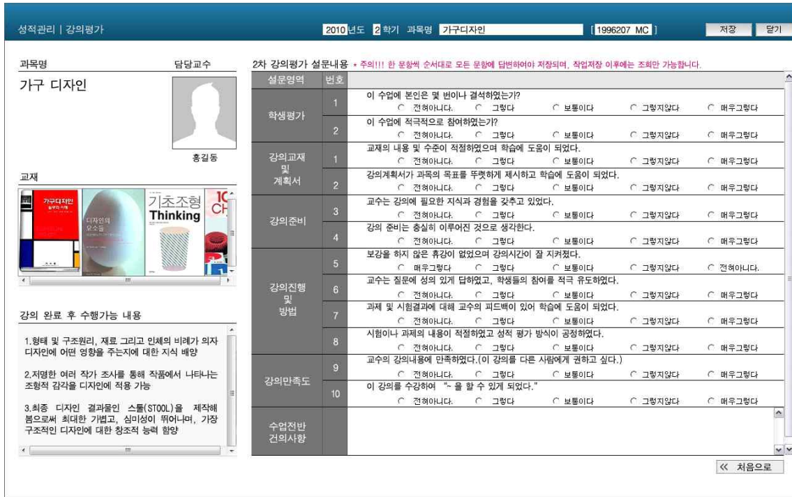
그림 2-4 수강생용 - 2차 평가 전체항목화면