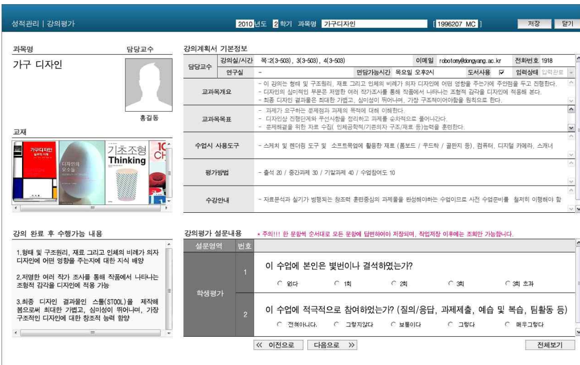
그림 2-1 수강생용 - 1차 평가 세부평가화면