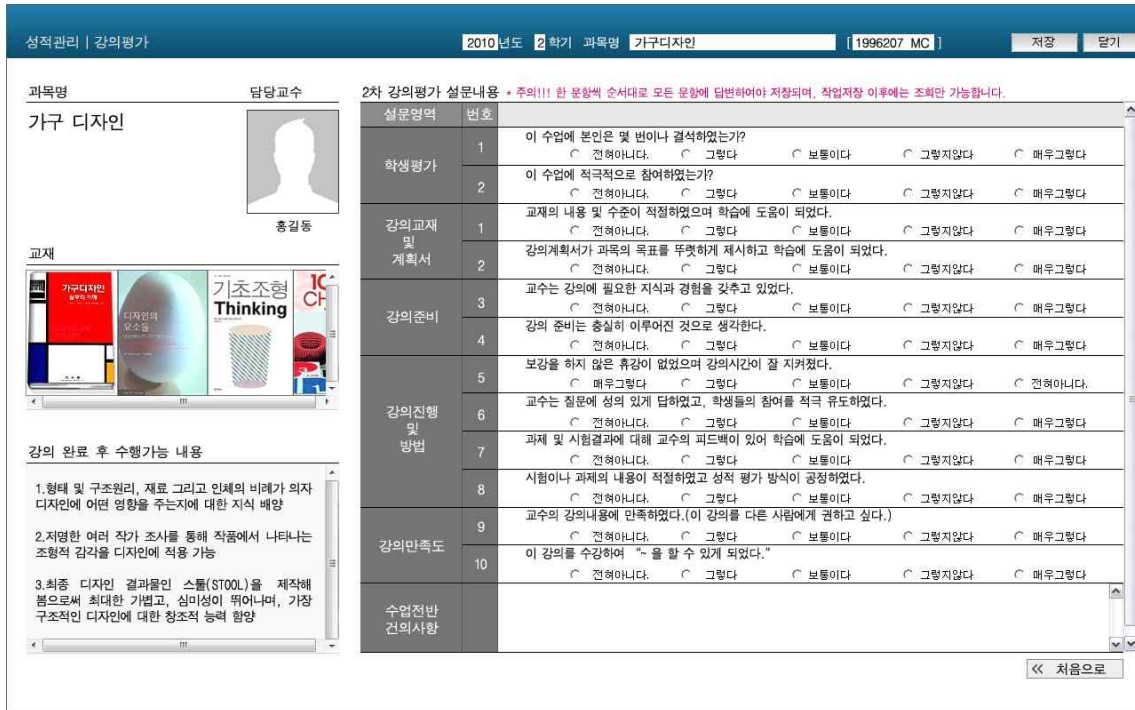
그림 2-4 수강생용 - 2차 평가 전체항목화면